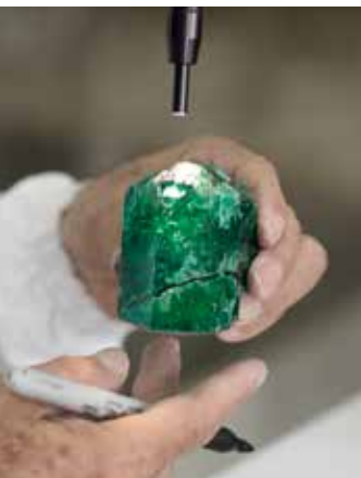
LECTURE DU BRUT

Ces expertises sont aussi complétées par des collaborations ponctuelles avec des ateliers de New York et Hong Kong.