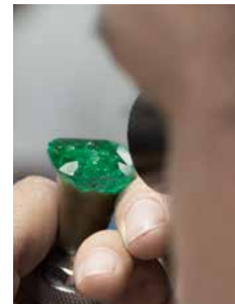
VÉRIFICATION DU POLI